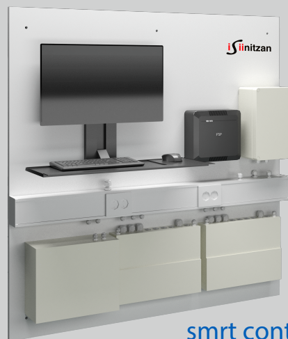
smrt control board - 126